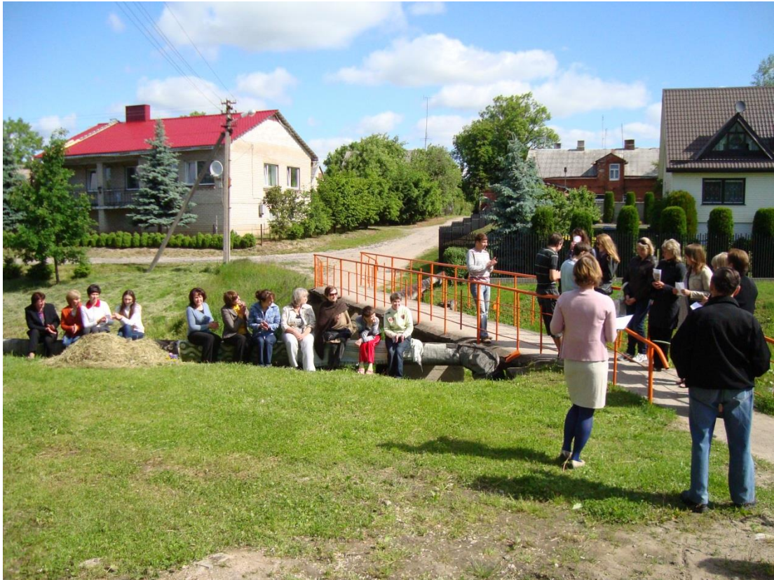
Skaitymai prie Meilės tilto

Birželio 22 dieną 106-ųjų rašytojo Antano Vaičiulaičio gimimo metinių išvakarėse, Vilkaviškio viešojoje bibliotekoje įvyko konkurso „Gimtoji žemė tavęs ilgisi ir savo širdyje tavęs didžiai pasigenda“ nugalėtojų apdovanojimas. Konkursui iš viso buvo pateiktas 141 darbas: 18 prozos ir poezijos tekstų bei 123 dailės kūriniai. Dešimčiai ugdomo įstaigų atstovavę jaunieji kūrėjai buvo suskirstyti į 4 amžiaus grupes. Suaugusieji, kurių dalyvavo 9, sudarė atskirą konkursantų grupę. Vertinimo komisija gilinosi ir į kelis kolektyvinius darbus, tad Vilkaviškio krašto kūrėjų, savo idėjomis pagerbusių rašytoją A. Vaičiulaitį, skaičius perkopė per pusantro šimto.