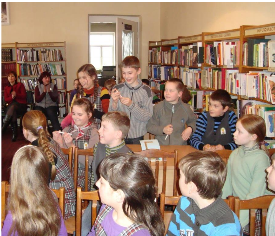
Viktorinos „Ar esi gyvūnų draugas?“ dalyviai