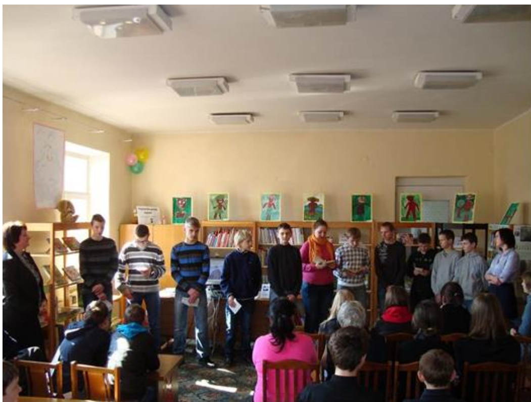
Vilkaviškio pagrindinės mokyklos 8 - 9 klasių skaitovai deklamavo Maironio eiles.

Baigiantis renginiui mokiniams pateikti klausimai „Orientuokis bibliotekoje“. Paaugliai aktyviai atsakinėjo į klausimus apie biblioteką.