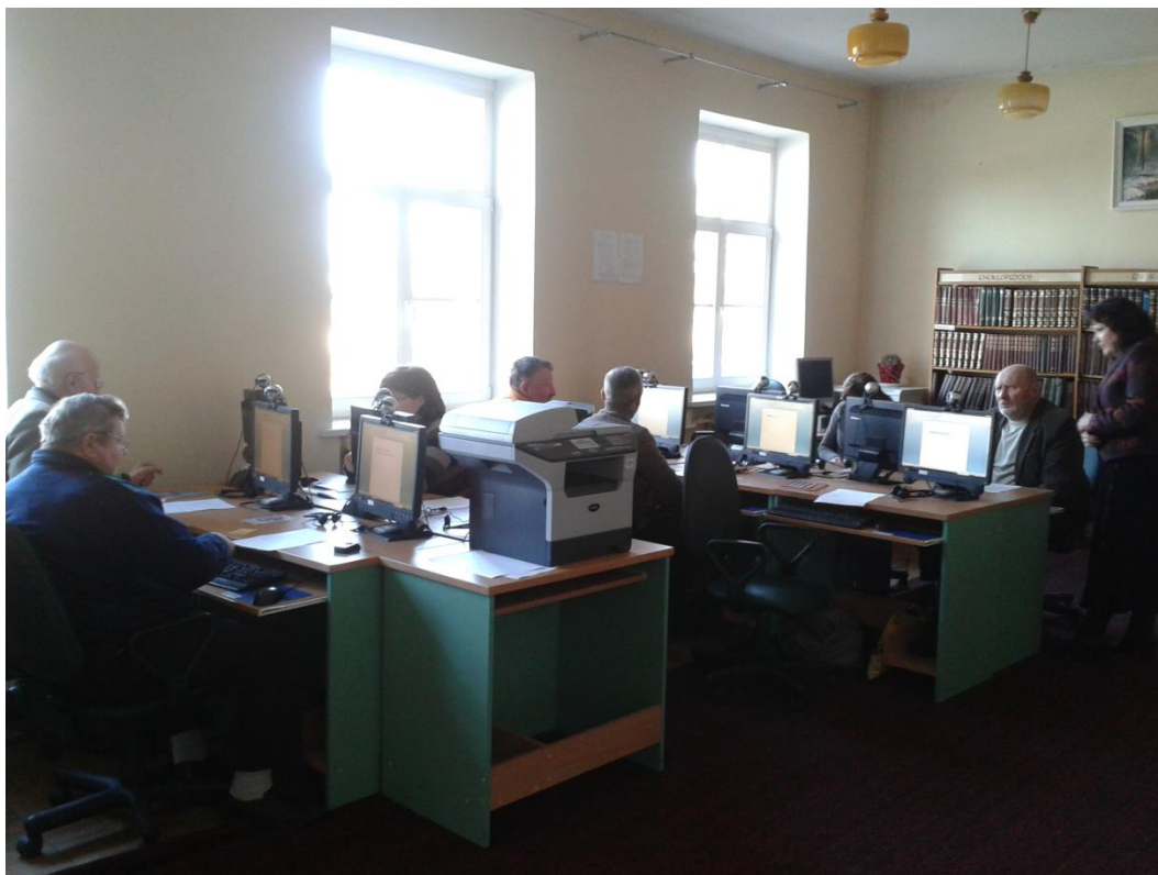
Gyventojų kompiuterinio raštingumo mokymų metu

2012 metais bibliotekoje vyko projekto „Bibliotekos pažangai“ akcijos – tiesioginės transliacijos įvairiomis temomis, kuriose dalyvavo 82 lankytojai.