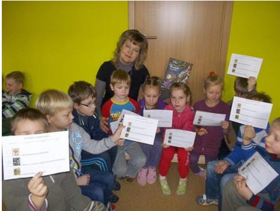
Vilkaviškio vaikų lopšelio – darželio „Buratinas” auklėtiniai

Vasario 22 d. Vilkaviškio viešojoje bibliotekoje vyravo Užgavėnių nuotaikos. Dar kartą „pagrūmoti“ niekaip nepasibaigiančiai žiemai į biblioteką susirinko Vilkaviškio vaikų lopšelio - darželio „Pasaka“ ugdytiniai, kiti bibliotekos lankytojai.