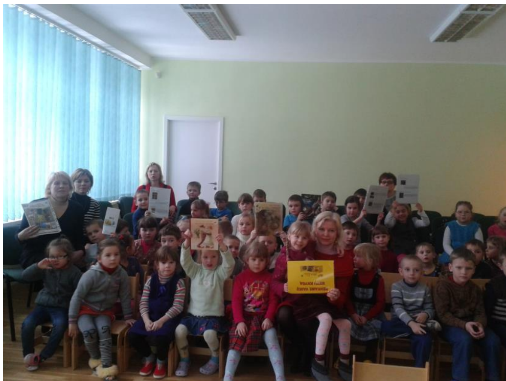
Vilkaviškio vaikų lopšelio – darželio “Pasaka” auklėtiniai.

Sausio 18 d. Vilkaviškio vaikų lopšelio-darželio „Pasaka“ ugdytiniais vedėme literatūros valandėlę „Renkame vaikų Metų knygą“. Supažindinome su vaikų Metų knygomis ir jų autoriais, trumpai papasakojome knygų turinį ir apie autorius, rodėme išleistas gražiausias bei nominuotas knygeles. Vaikai vartė knygas ir klausėsi ištraukų įrašų, kurios buvo skaitomos per LRT laidą „Vakaro pasaka“. Renginio pabaigoje vaikai savo nuomonę apie labiausiai patikusią knygą pareiškė balsavimui paruoštame lape, kuriame buvo visų trijų knygų nuotraukos ir pavadinimai. Organizuotame balsavime dalyvavo Vilkaviškio vaikų lopšelio-darželio „Pasaka“ penkiamečių grupės: „Nykštukai“, „Ežiukai“ ir priešmokyklinio ugdymo grupė „Pelėdžiukai“. Kiekvieno vaiko balsą pažymėjome Metų knygos rinkimų interneto svetainėje ir pranešėme apie organizuoto balsavimo rezultatus.