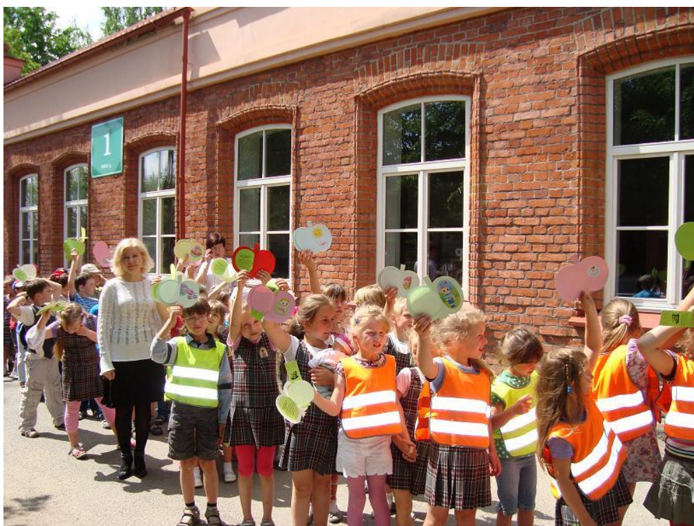
Vilkaviškio pradinės mokyklos pirmokėliai susidraugavo su biblioteka

pabaigoje parodė Vilkaviškio viešojoje bibliotekoje pirmosios knygelės šventėje „Aš jau skaitau!“. Vaikų literatūros skyrius pasipuošė pirmokėlių kūrybiniais darbais „Parašysiu aš raidelę“. Vaikų literatūros skyriaus vedėja Alviną Radžvilienė skaitė žymių žmonių mintis apie knygas, minė mįsles. Pirmokai deklamavo eilėraščius su abėcėlės raide, dainavo dainas. Svečiams neteko nuobodžiauti, kiekvienos klasės atstovas buvo kviečiamas garsiai paskaityti ištrauką iš rusų liaudies pasakos „Auksinė žuvelė“. Šventės pabaigoje svečiams skambėjo šiltas palinkėjimas. Juk pirmoji pažintis su knyga buvo dar labai trumpa, tik nuo raidelių prie pirmos knygelės. Nuo šiol knygelės juos lydės visą gyvenimą. Šios šventės tikslas – bibliotekininkų ir mokytojų noras, kad vaikučiai pamiltų ir gerbtų knygeles. Mokiniam prisiminimui apie šią šventę Vaikų literatūros skyriaus darbuotojos įteikė lankstinukus – kvietimus draugauti su biblioteka, taip pat padėkojo mokytojoms, kurios šiai šventei ruošėsi kartu su savo mokinukais visus mokslo metus, siekdamos ugdyti aktyvų skaitytoją, gerbiantį knygą, kuris taptų kūrybinga asmenybe.