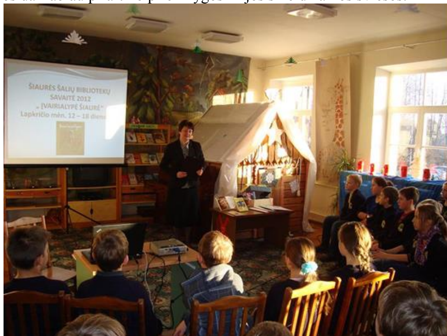
Literatūros valandėlė "Skaityme Šiaurės šalių literatūrą"