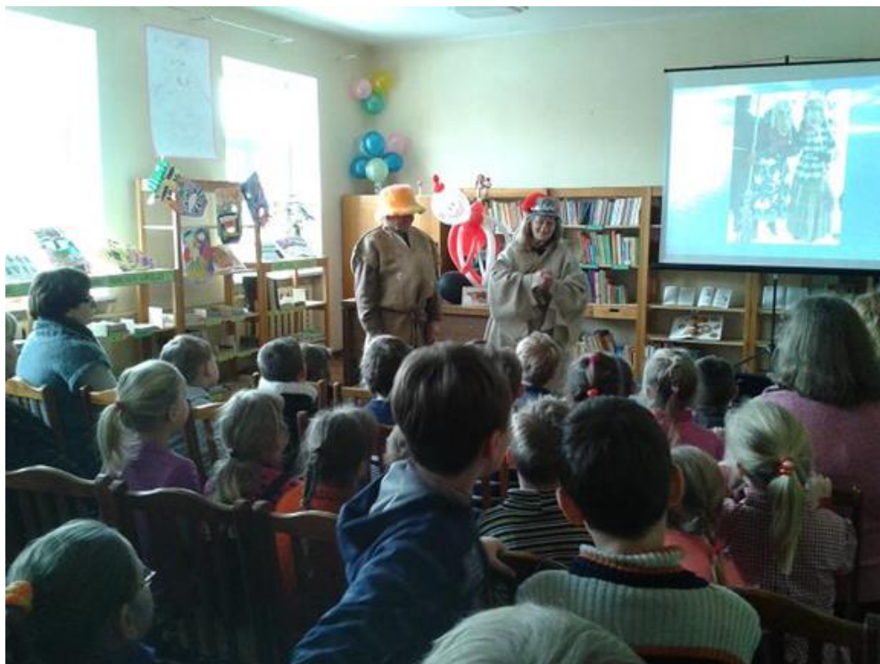
Vaikučius aplankė Užgavėnių personažai Lašininis ir Kanapinis