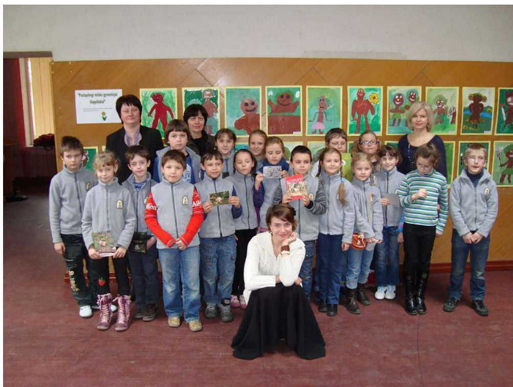
Rašytoja su „Gugeliukų“ iliustracijų autoriais – Vilkaviškio pradinės mokyklos 2 c klasės mokiniais