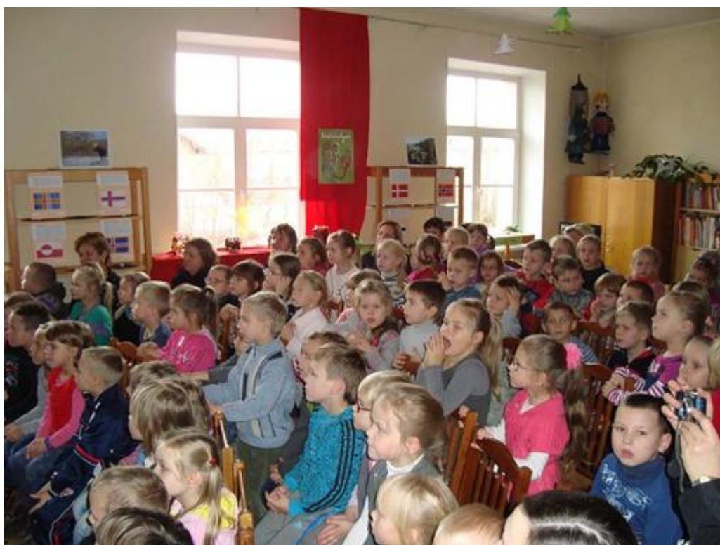
Vaidinimo "Mamulė Mū ir Varna" žiūrovai – Vilkaviškio vaikų lopšelių – darželių „Pasaka“ ir „Buratinas“ priešmokyklinio ugdymo grupių vaikučiai. (R.Šūmakario nuotr.)

Lapkričio 15 d. į tautodailininkės Birutės Pavloviienės rankdarbių parodą – pristatymą " Kad Šiaurės šaltis būtų nebaisus " rinkosi Vilkaviškio pradinės mokyklos 4 d, 4 e ir 4 f klasių mokiniai, kuriuos supažindinome su "Šiaurietišku raštų margumynais": vaikai sužinojo, kaip atrodo Farerų salų, Danijos, Islandijos, Norvegijos, Suomijos, Švedijos tautiniai kostiumai, kad Šiaurės