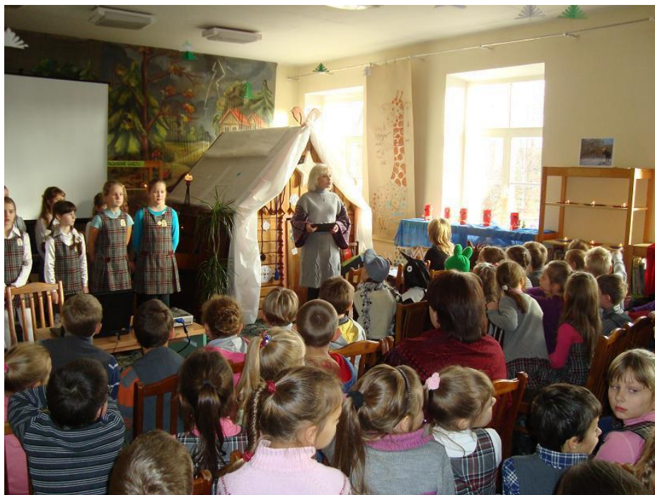
„Šviesos ir žodžio šventės“ atidarymas