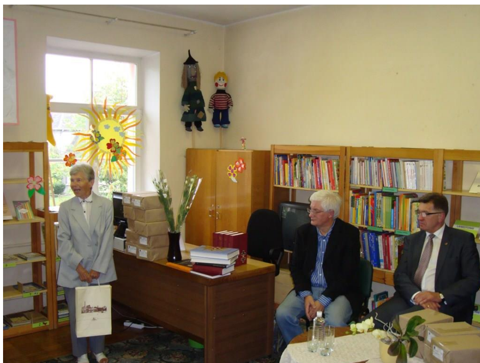
Muziejninė D.Ardzijauskaitė – viena iš labiausiai besidominčių garsiais gimtojo krašto žmonėmis