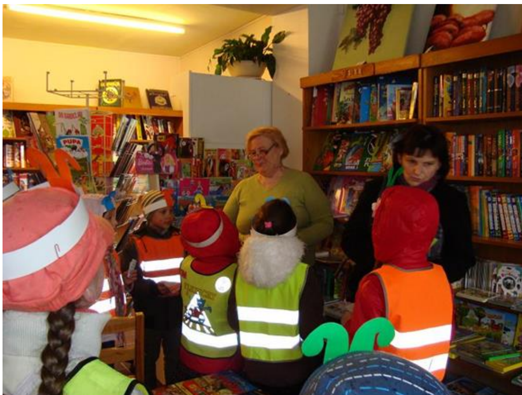
„Skaitymo virusiukai“ lankėsi knygyne