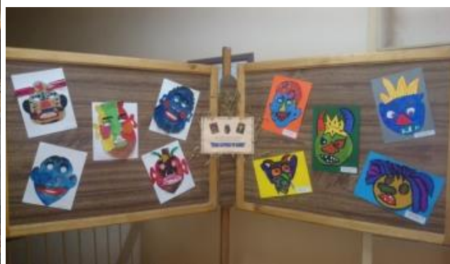
Užgavėnių kaukių paroda „Žiema slepiasi po kauke“, (R. Šumakario nuotr.)

Bibliotekos darbuotojos norėdamos paskatinti vaikus daugiau skaityti, pravedė knygų aptarimus, rengė piešinių parodas apie perskaitytų knygų herojus. Buvo rengiami ir bendri renginiai, kuriuose dalyvavo vaikai ir suaugusieji. Vykstantys renginiai bibliotekoje yra tarsi bibliotekos paslaugų reklama, ryšių su visuomene plėtra ir bibliotekos prestižo didinimas.