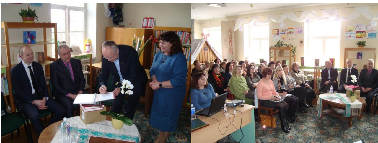
Viešoji biblioteka džiaugiasi dabar jau turinti savo globėją. Šį įsipareigojimą priėmė krašto apsaugos ministras Juozas Olekas.