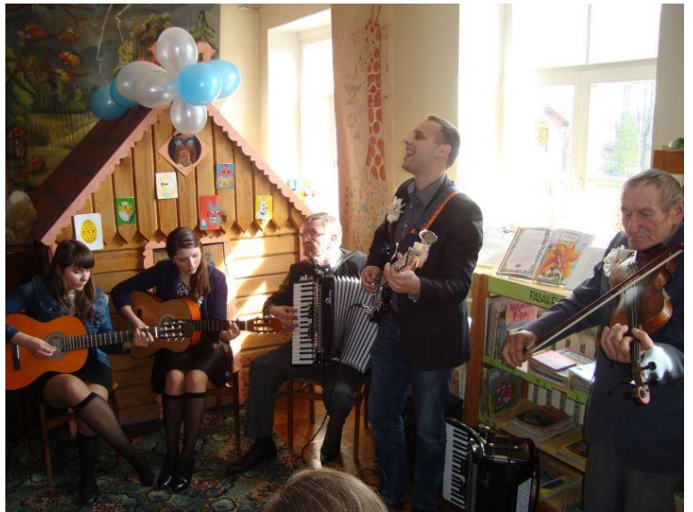
Gerą nuotaiką palaikė Karklinių liaudies muzikos kolektyvas.