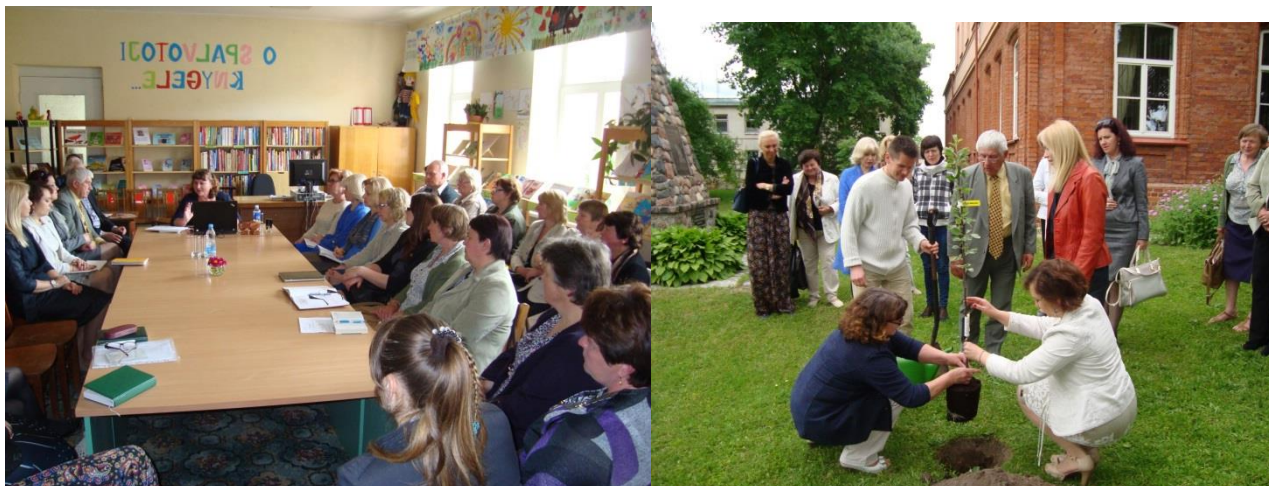
Projekto „Vilkaviškio krašto e-etnografijos akademija“ pristatymas. 2015 06 09

Prieš imdamiesi idėjos įgyvendinimo darbų rajono bibliotekininkai, jų partneriai ir skaitytojai prie Vilkaviškio viešosios bibliotekos pasodino obelaitę, kuri augdama simbolizuos pažangą ir projekto vyksmą.