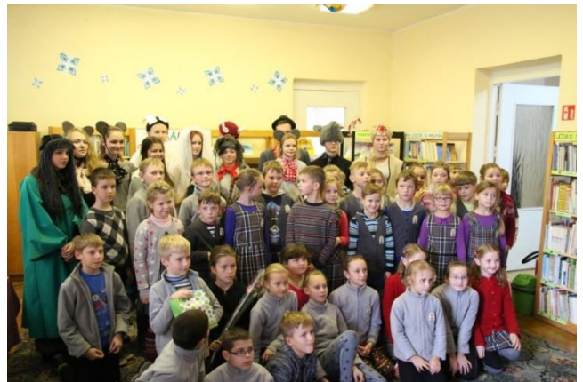
Viktorina „Šiaurės šalių herojai“