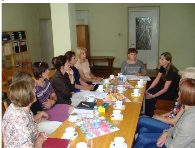
Pasitarimo metu dėl projekto. 2015 07 07

Kadangi biblioteka rengė projektą Bibliotekos pažangai2 „Vilkaviškio krašto e-etnografijos akademija“, tad rengiant ir įgyvendinant šį projektą, vyko keletas susitikimų ir pasitarimų su partneriais ir bendruomenės nariais.