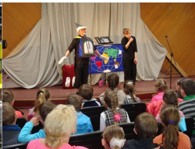
Kelionės maršrutas - visas pasaulis.

Gegužės 8 d. Trečiojo amžiaus universiteto studentai sužinojo apie civilinės saugos organizavimą Vilkaviškio rajone.