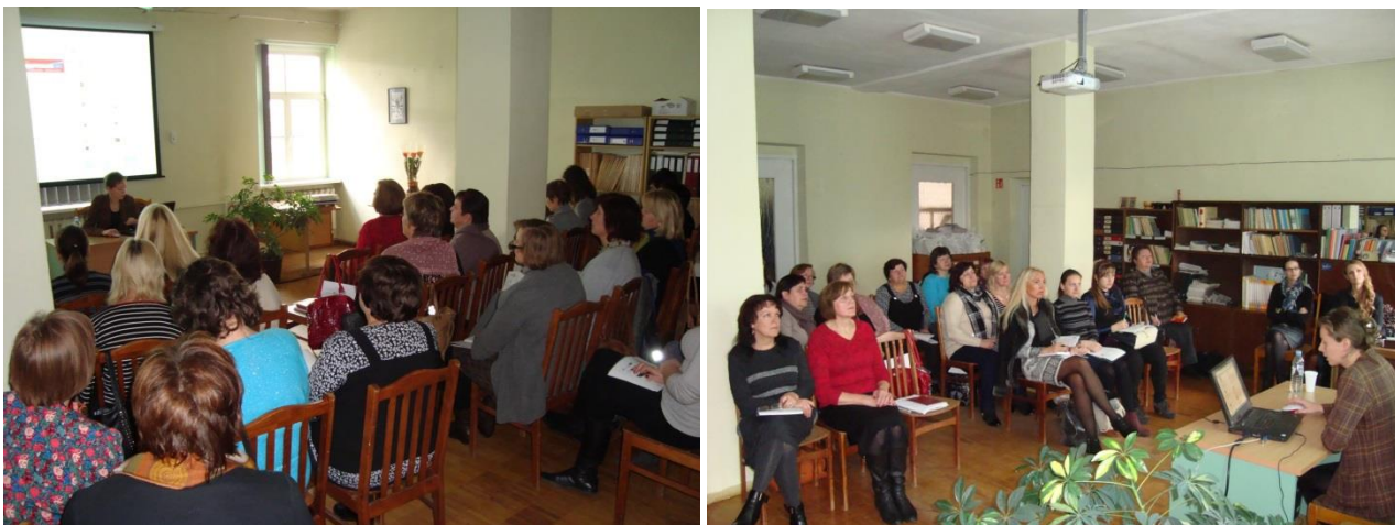
Seminaras „Skaitmeninimas ir regiono bibliotekos“. 2015 10 28.