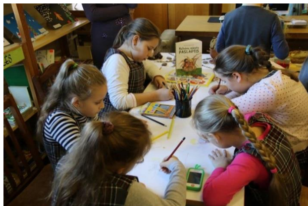
Kūrybinės dirbtuvės „Miškinukų miestas“