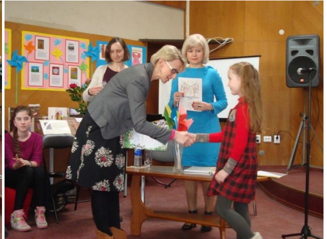
Apdovanojami aktyviausi jaunieji Vaikų literatūros skyrius skaitytojai.