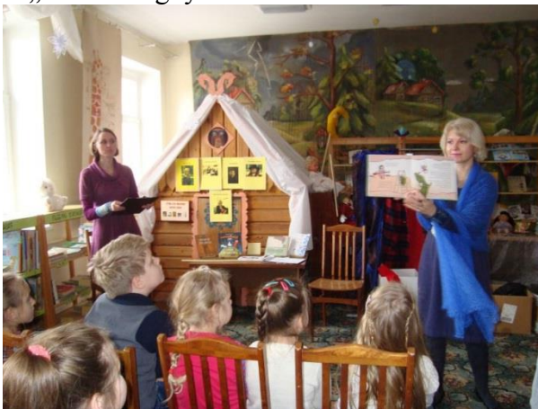
Vaikų Metų knygų pristatymas bibliotekoje..