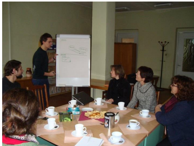
Pasitarimo metu dėl svetainės kūrimo. 2015 11 03