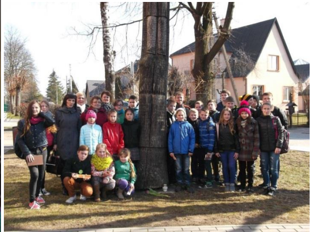
Renginio dalyviai prie koplytstulpio knygnešiams.