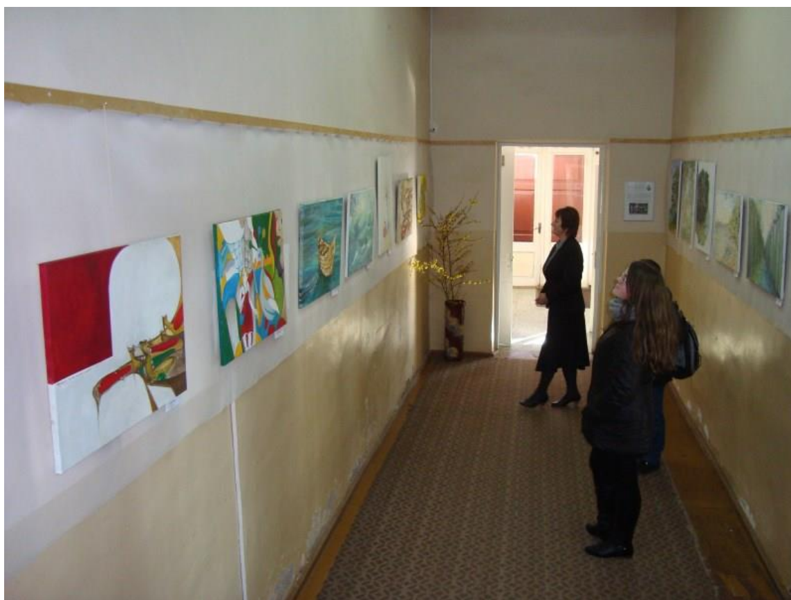
Tarptautinio plenero „Isaako Levitano pėdsakais“ darbai.

Vilkaviškio viešosios bibliotekos erdvę puošė tarptautinio plenero „Isaako Levitano pėdsakais“ darbai. Jie ir įkvėpė išnaudoti paveikslų skleidžiamą energiją išnaudoti edukacinei, terapinei veiklai.