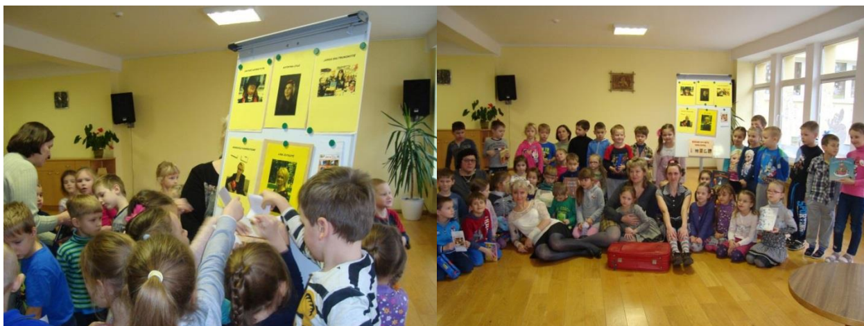
Vaikų knygos pristatymas „Buratino“ darželyje. 2015 01 14

Po knygelių pristatymo visi padainavo, pasimankštino ir išsidalino po balsavimo lapelį, kuriame vaikai pažymėjo labiausiai patikusią knygelę. Susumavę balsus, sužinojo, kokia knygelė darželinukams labiausiai patiko ir paprašė, kad nupieštų iliustraciją parodai „Mėgstamiausios vaikų knygelės herojus“.