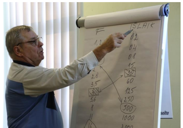
Bibliotekininkės gilinosi į skaitmeninės fotografijos subtilybes. 2015 12 17