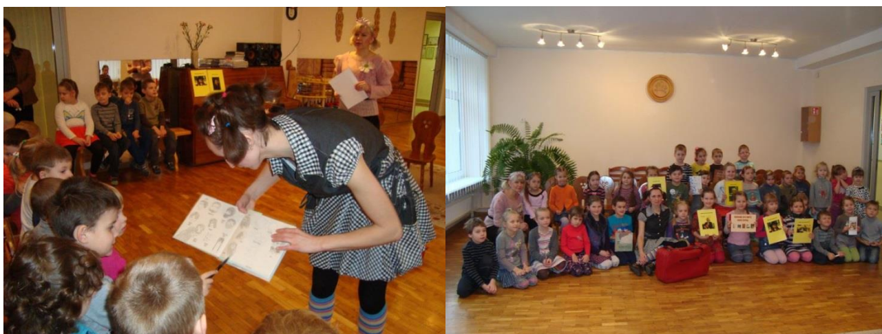
Vaikų knygos pristatymas „Eglutės“ darželyje. 2015 01 16