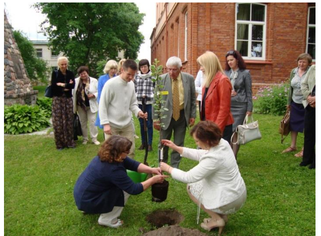
Sodinama obelaitė.

Birželio 27 d. Vilkaviškio rajono savivaldybės viešoji biblioteka pirmą kartą dalyvavo miesto šventėje „Mano miestas Lietuvoj įrašytas“. Kiemelyje „Biblioteka - atvira erdvė bendruomenei“ veikė inovacijų laboratorija vaikams „Mano svajonių Vilkaviškis“, kurioje norintys piešė savo miestą, kokį įsivaizduoja po daugelio metų, arba kokį norėtų matyti dabar. Taip pat vaikai kūrė skirtukus knygoms. Susirinkusiems miesto gyventojams ir svečiams buvo siūloma pasitikrinti žinias viktorinose „Vilkaviškis literatūros tekstuose“ ir „Ką žinai apie viešąją biblioteką - jos šiandieną ir istoriją“ Vilkaviškio viešosios bibliotekos darbuotojos stengėsi kuo daugiau miestiečių ir miesto svečių užkrėsti skaitymo virusu lipindamos lankytojams lipdukus su bibliotekos logotipu ir raginimu skaityti. Kiekvienas norintis galėjo sužinoti, kokiomis paslaptimis dalinasi „Išminties knyga“, išsitraukdamas iš jos gelmių lapelius su užrašytais garsių žmonių mintimis. Renginio dalyviai ne tik susipažino su biblioteka, bet ir buvo apdovanoti prizais už aktyvų dalyvavimą viktorinose ir kitose bibliotekininkų organizuojamose veiklose. Nuo šventės triukšmo lankytojai galėjo pailsėti ir spaudą paskaityti veikiančioje lauko skaitykloje.