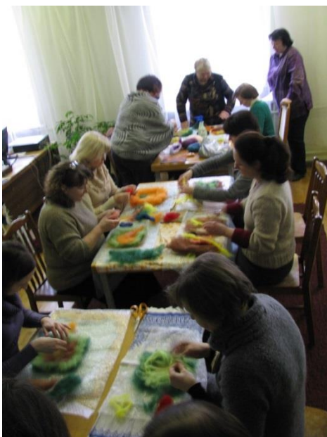
Pačiame darbų įkarštyje.