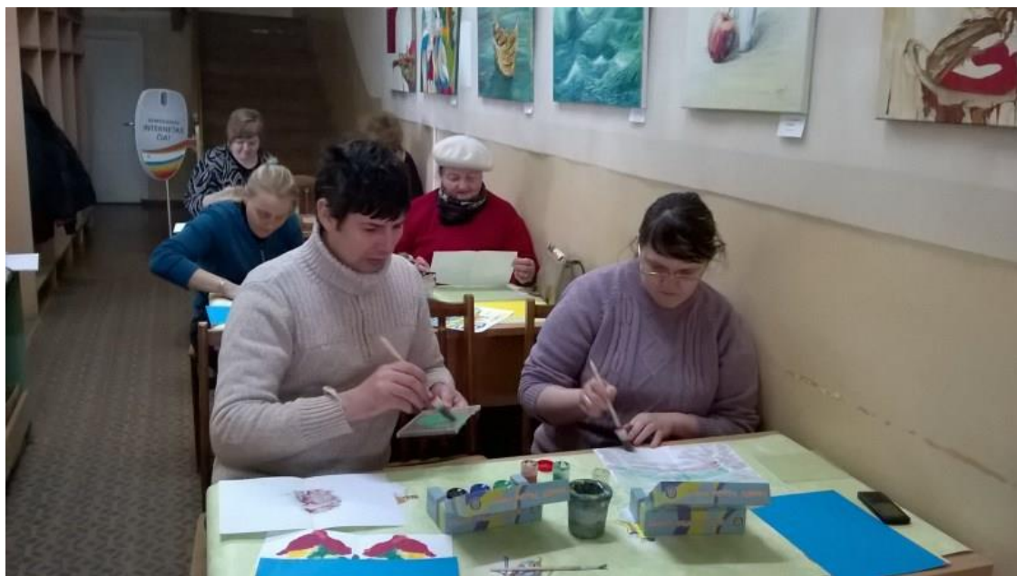
Terapijos dalyviai pasinėrė į spalvų magiją.

Kovo 23 d. Vilkaviškio psichikos sveikatos centro užimtumo terapijos pacientai bibliotekos fojė, supami plenero metu tapytų paveikslų, susipažino su I. Levitano biografija, kūryba bei monotipijos technika. Panaudodami šį nesudėtingą kūrybos būdą, bibliotekos svečiai išmėgino įvairius spalvų derinius, kūrė drugelių siluetus ir rudens peizažus, primenančius I. Levitano paveikslų temas ir koloritą.