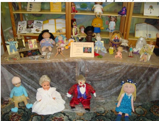
Paroda „Aplankyti, pamatyti, kokią lėlę aš turiu...“

Vaikų renginiuose buvo minimos Lietuvos valstybinės šventės, tarptautinė vaikų knygos diena, tarptautinė vaikų gynimo diena, Motinos diena, prisiminta rašytojų, kitų žymių veikėjų jubiliejai. Vaikai į bibliotekas ėjo ne tik skaityti, bet ir pabendrauti, piešti, žaisti, kurti, aptarti perskaitytas knygas. Bibliotekoje vyko renginiai, supažindinantys jaunuosius vartotojus su poetų ir rašytojų kūryba, lavinantys vaikų gebėjimus, plečiantys jų akiratį. Jiems organizuojamos šventės, viktorinos, literatūros ir teminės popietės, žaidimai, rengiamos parodos – pristatymai.