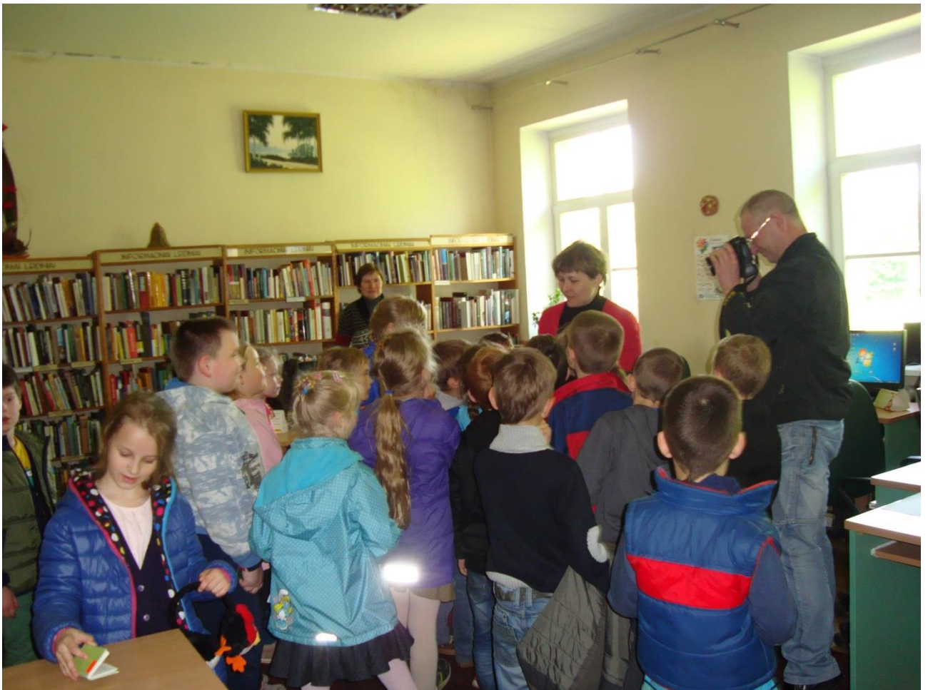
Akimirka iš gegužės 22 d. ekskursijos.