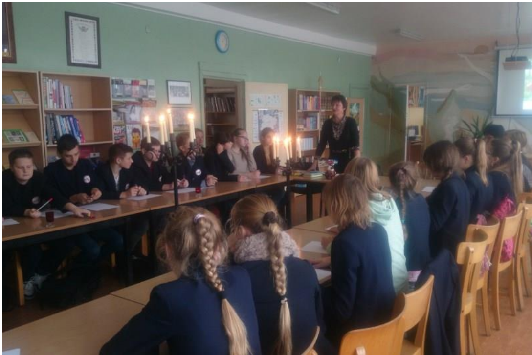
Literatūros valandėlė S. Nėries pagrindinėje mokykloje.