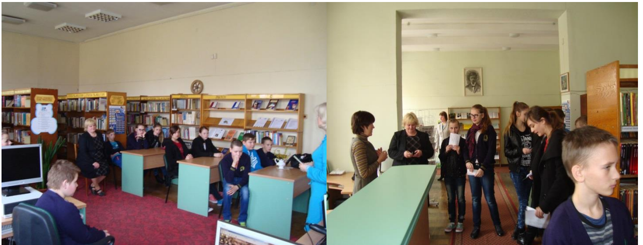
Akimirka iš kovo 26 d. ekskursijos.