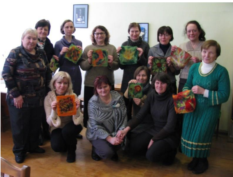
Kiekviena su savo darbeliais.

Bendradarbiaujant su Trečiojo amžiaus universiteto Vilkaviškio skyriumi bibliotekoje nuolat vyksta paskaitos TAU studentams-senjorams. 2015 metais TAU studentai senjorai sudalyvavo aštuoniose paskaitose.