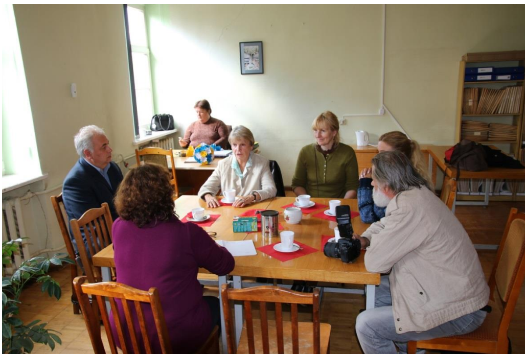
Pasitarimo metu.