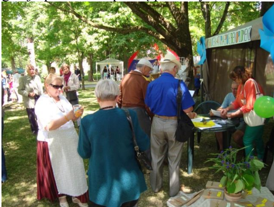
Miesto šventėje.

Birželio 27 d. Vilkaviškio rajono savivaldybės viešoji biblioteka pirmą kartą dalyvavo miesto šventėje „Mano miestas Lietuvoj įrašytas“. Kiemelyje „Biblioteka - atvira erdvė bendruomenei“ veikė inovacijų laboratorija vaikams „Mano svajonių Vilkaviškis“, kurioje norintys piešė savo miestą, kokį įsivaizduoja po daugelio metų, arba kokį norėtų matyti dabar. Taip pat vaikai kūrė skirtukus knygoms. Susirinkusiems miesto gyventojams ir svečiams buvo siūloma pasitikrinti žinias viktorinose „Vilkaviškis literatūros tekstuose“ ir „Ką žinai apie viešąją biblioteką - jos šiandieną ir istoriją“ Vilkaviškio viešosios bibliotekos darbuotojos stengėsi kuo daugiau miestiečių ir miesto svečių užkrėsti skaitymo virusu lipindamos lankytojams lipdukus su bibliotekos logotipu ir raginimu skaityti. Kiekvienas norintis galėjo sužinoti, kokiomis paslaptimis dalinasi „Išminties knyga“, išsitraukdamas iš jos gelmių lapelius su užrašytais garsių žmonių mintimis. Renginio dalyviai ne tik susipažino su biblioteka, bet ir buvo apdovanoti prizais už aktyvų dalyvavimą viktorinose ir kitose bibliotekininkų organizuojamose veiklose. Nuo šventės triukšmo lankytojai galėjo pailsėti ir spaudą paskaityti veikiančioje lauko skaitykloje.