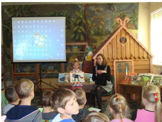
Vaikai pristato savo darbelius.