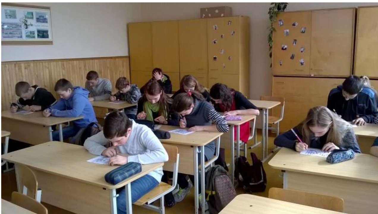
Septintokai susikaupę lenktyniavimo, kas bus dėmesingiausias.

Kovo 25 d. vyko knygų pristatymas netradicinėje erdvėje, „Akviliukės“ žaidimų kambaryje.