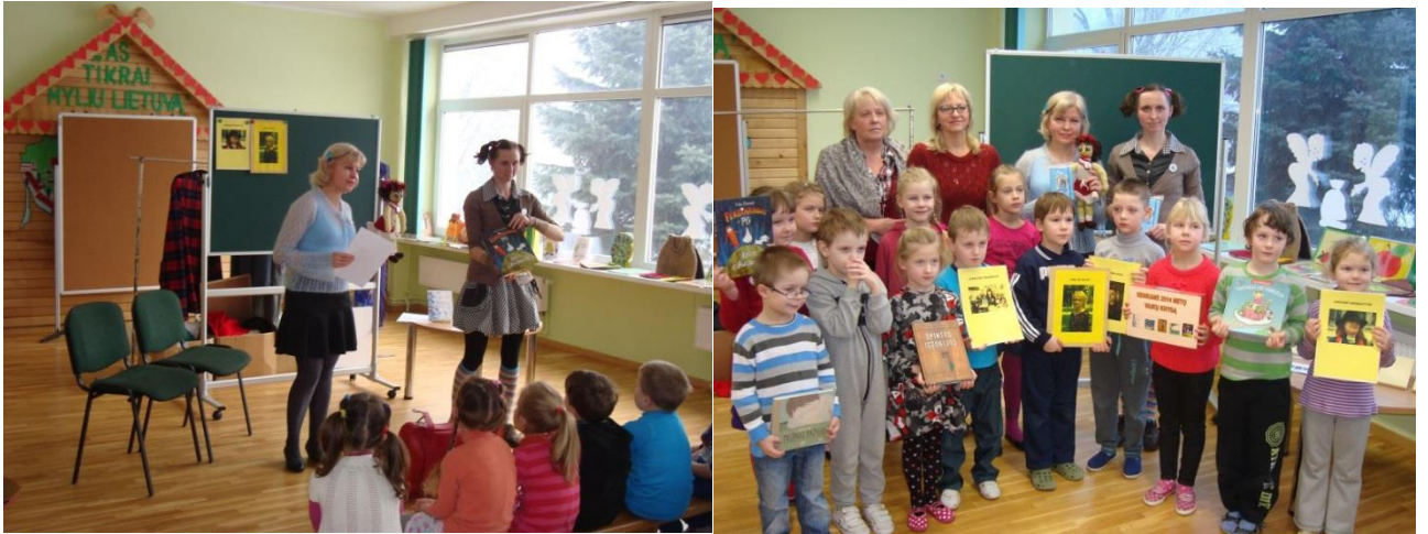
Vaikų Metų knygų pristatymas vaikų l/d „Pasaka“