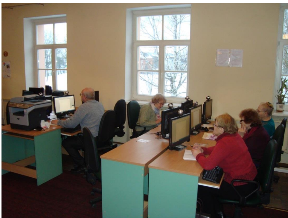
Kompiuterinio raštingumo 2015 01 29

Galima pastebėti, kad šių mokymų poreikis labai sumažėjęs. Išlieka stabilus individualių mokymų ir konsultacijų poreikis. Todėl galima teigti, kad su kompiuterinio raštingumo edukacinių veiklų ir paslaugų srityje išaugo individualizuotų paslaugų poreikis, reikalaujantis individualizuoto požiūrio į paslaugų vartotoją. Mokyti grupėse 6 vartotojai.