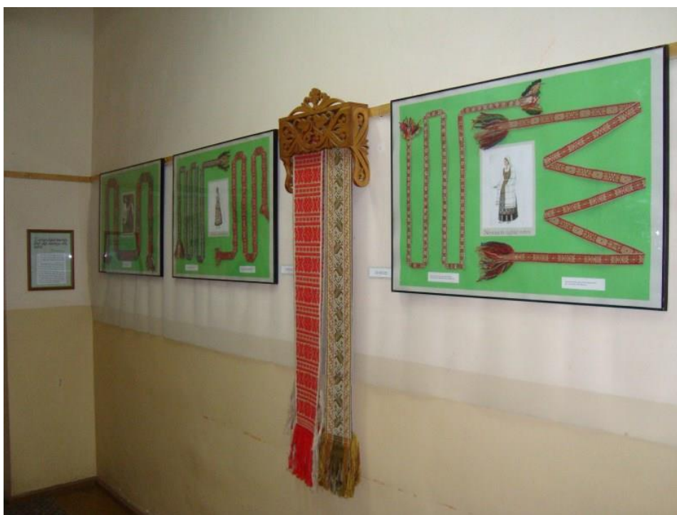
Paroda Vasario 16-ajai.

Vilkaviškio viešosios bibliotekos erdvę puošė tarptautinio plenero „Isaako Levitano pėdsakais“ darbai. Jie ir įkvėpė išnaudoti paveikslų skleidžiamą energiją išnaudoti edukacinei, terapinei veiklai.