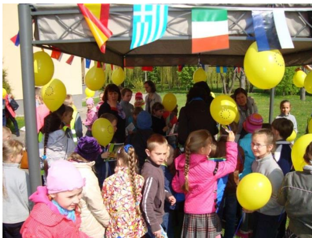
Lauko skaityklą užplūdo skaitytojai.