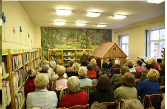
Salė vos talpino gerbėjus