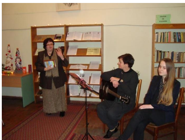
„Baltų laiškų“ skaitymai Vilkaviškio bibliotekoje.