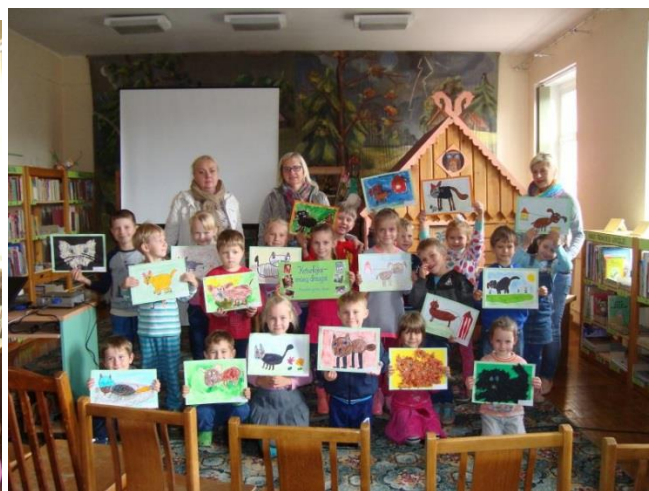
Renginio dalyviai su savo darbais.

Vilkaviškio viešosios bibliotekos Vaikų literatūros skyrius Šiaurės šalių bibliotekų savaitėje dalyvavo aštuntą kartą. Šiomet prie šio projekto prisijungė Vilkaviškio viešosios bibliotekos Bibliografijos ir informacijos skyrius ir dešimt filialų. Pagrindinė Šiaurės šalių bibliotekų savaitės idėja - populiarinti literatūrą ir skaitymą, skatinti savišvietą, organizuojant kultūros renginius bibliotekose bendra pasiūlyta tema.