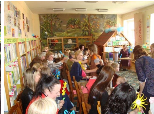
Mamoms dovanojamos rankų darbo gėlės.

Gegužės 14 dieną nuo žmonių atgijo pieva prie Vilkaviškio viešosios bibliotekos: vėlyvą popietę čia skambėjo vaikų klegesys, o temstant prie žvakių švieselių liejosi poezijos posmai.