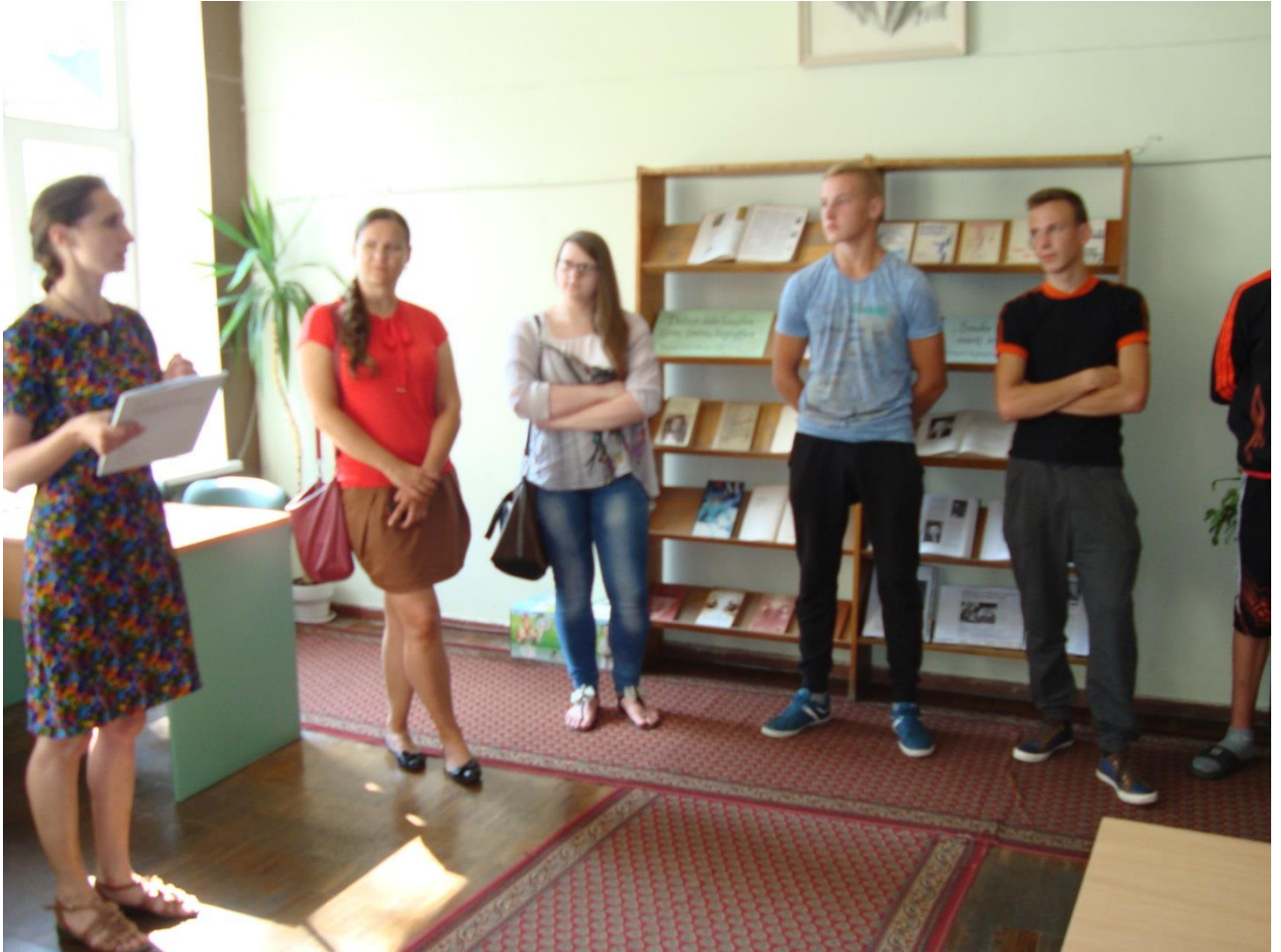
Akimirka iš rugpjūčio 7 d. ekskursijos.