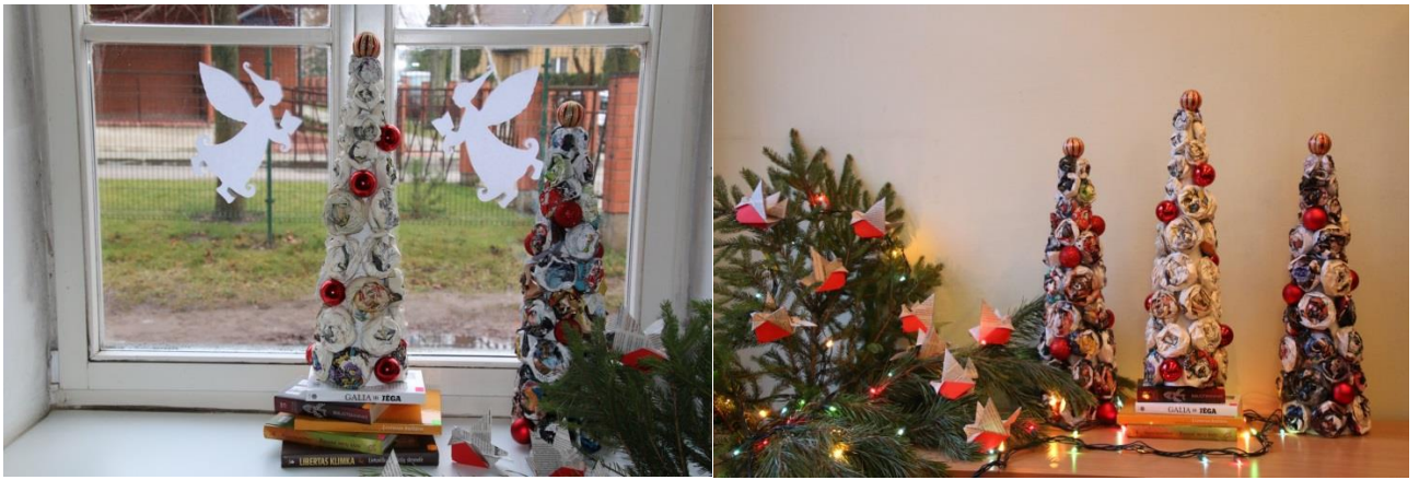
Kalėdinės dekoracijos.