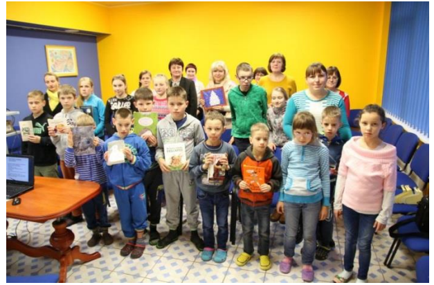
„Knygų Kalėdos“ Kybartų vaikų globos namuose .