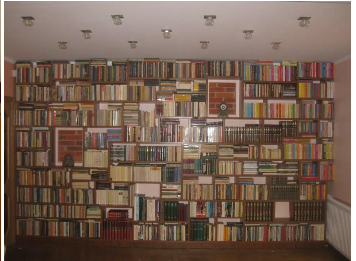
„Edita Mozūraitienė - nauja knyga ant mano stalo/ Nė karto Skaitytys neliesta, dar neskaityta/ Lyg paslaptis liepsnose virpančio kristalo, / Lyg tiltas, permestas nueit į sielą kitą“.