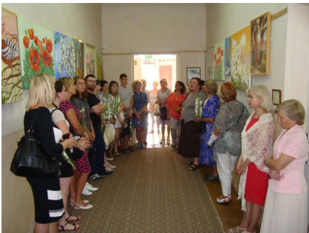
Parodos atidarymas.

„Tiek gražių žodžių apie save dar nesu girdėjusi“ - džiaugėsi Žydruolė,