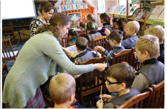
Pokalbis „Mano įspūdžiai iš Šiaurės šalių“.