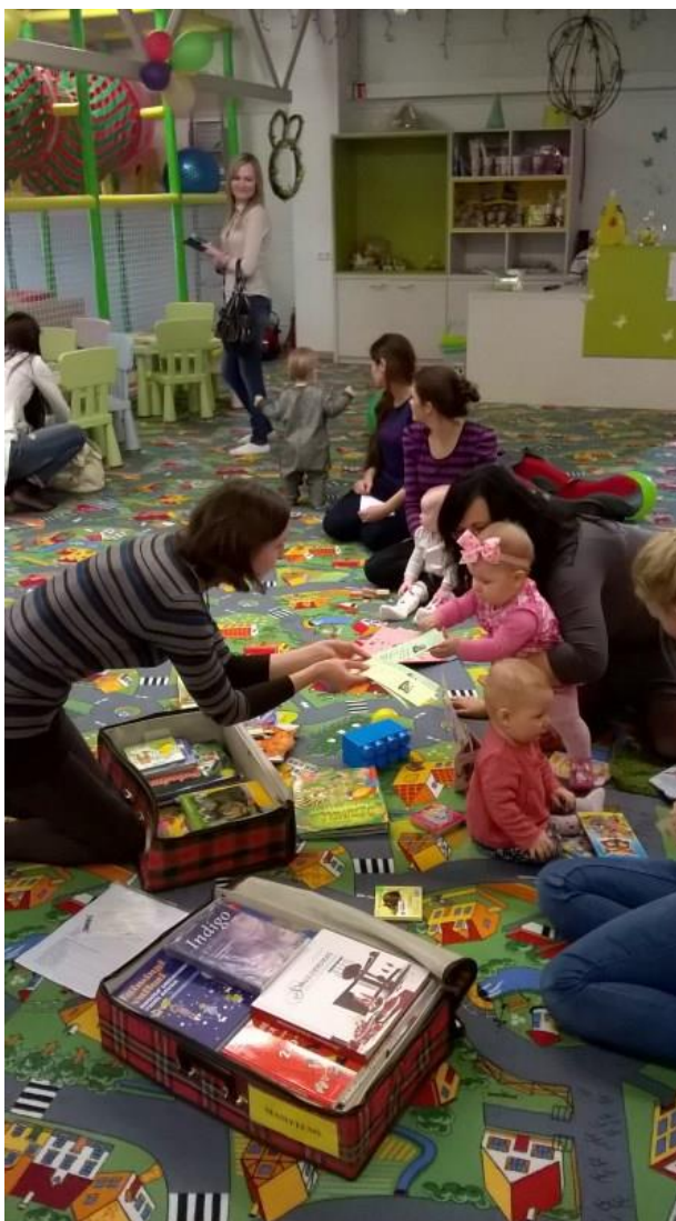
Bibliotekos darbuotojos atkeliavo į mamų klubą su pilnais lagaminais knygų.