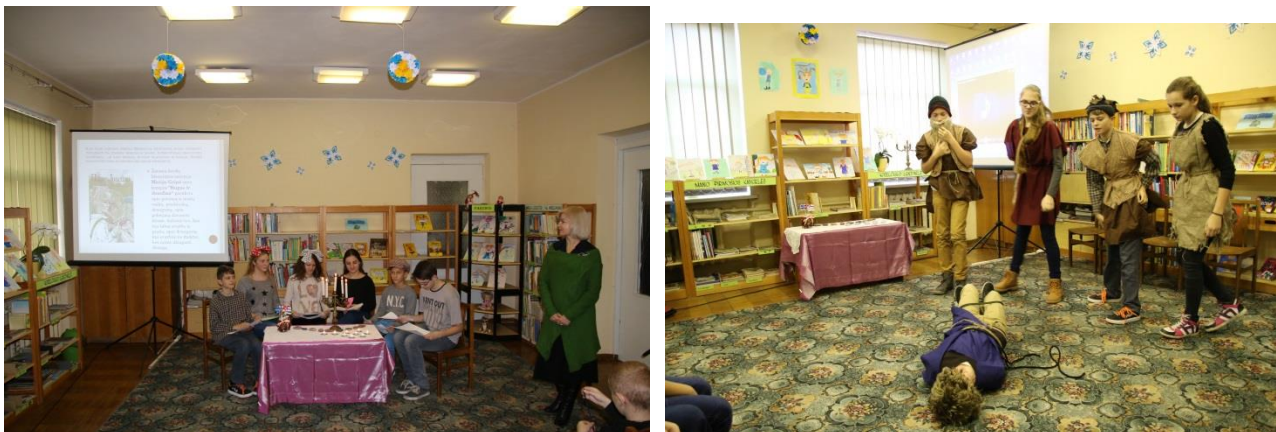
Šiaurės savaitės atidarymas.