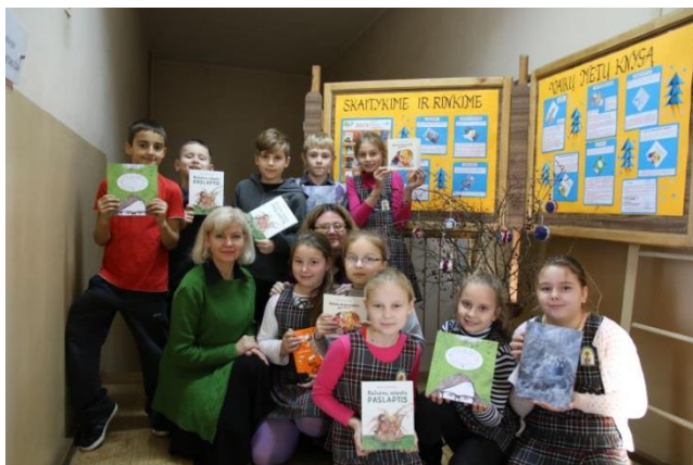
Vilkaviškio pradinės mokyklos „Knygnešiukai“ – „Vaikų Metų knygos rinkimų“ dalyviai.