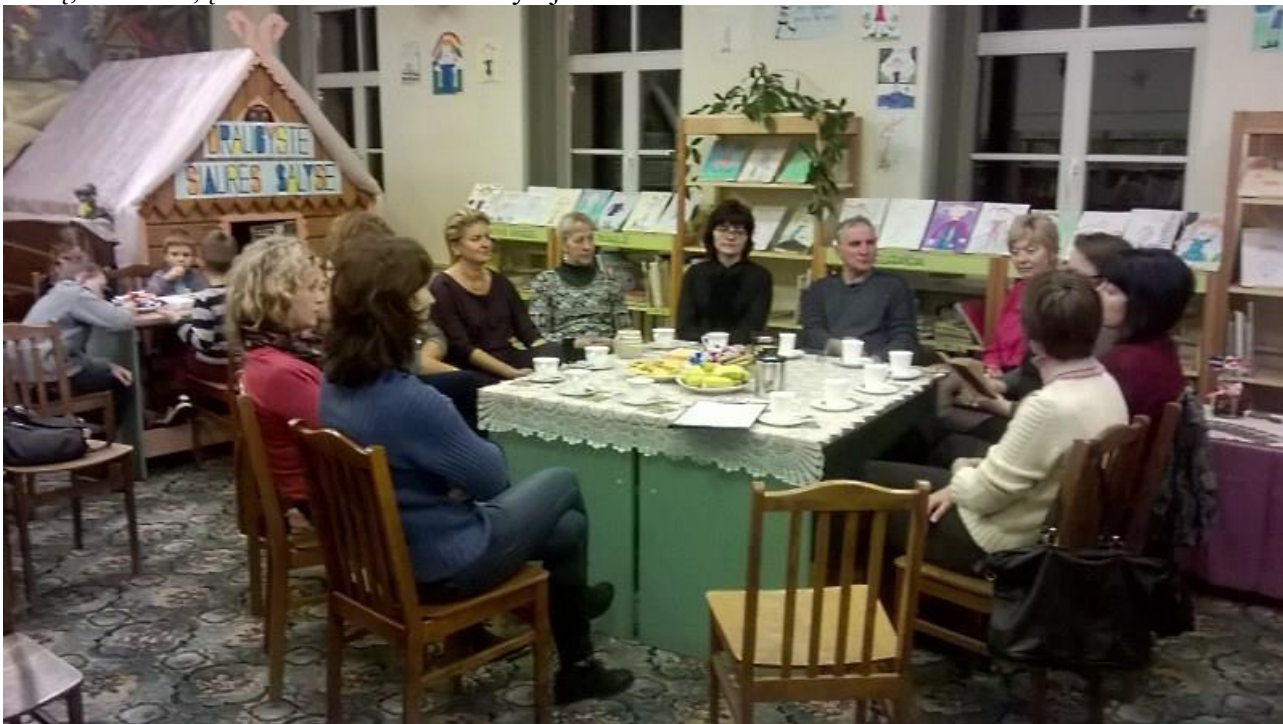
Šiaurės šalių skaitymai bibliotekoje

Egilio kelionės skaitymai paskatino paanalizuoti islandiškus vardus, kurie ir dabar sutinkami grožinėje literatūroje. Išsivystė diskusija, kam ir kur teko išgirsti panašius vardus, kokiuose kūriniuose juos teko sutikti. Renginio dalyviai vartė šiaurės šalių autorių knygas, dalinosi savo skaitymo išpuodžiais. Buvo prisimintos ir kelionės. Ne vienas, dalyvavęs renginyje, pasirodo, buvo aplankęs ir šiaurės šalis - Švediją, Islandiją ir kt. Svarbiausias susitikimo rezultatas - sąrašas knygų, kurios, pagalvojus apie šiaurės šalis, pirmiausiai atėjo į galvą. Renginio metu buvo siunčiamas popieriaus lapas, ir visi surašė savo prisimintas knygas, kai kurie pavadinimai buvo parašyti keletą kartų, vadinasi, įsiminė ne vienam skaitytojui.