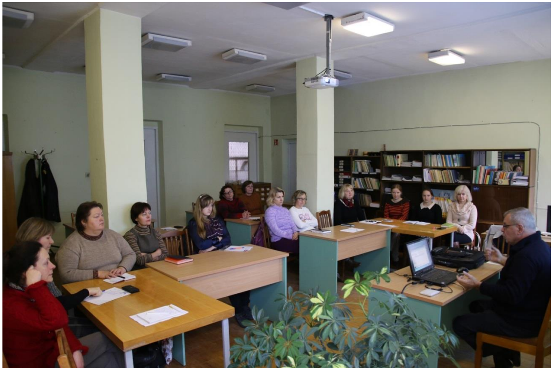
Bibliotekininkės gilinosi į skaitmeninės fotografijos subtilybes.2015 10 19