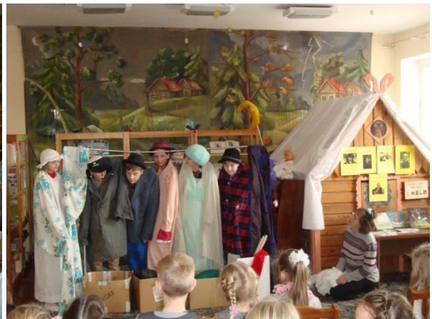
VVJC vaidinimas pagal D. Kandrotienės knygą „Spintos Istorijos“.

Kovo 16 d. knygnešio dienos rytą, Vilkaviškio viešojoje bibliotekoje Vaikų literatūros skyriuje rinkosi mokiniai pagerbti knygnešius. Literatūros valandėlėje „Širdis - pilna lietuviškų žodžių“ dalyvavo Vilkaviškio krašto muziejaus vyriausia fondų tvarkytoja, laikinai einanti