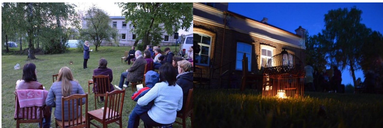
Vakaro skaitymai pievelėje prie bibliotekos.

skambėjo rimti ir linksmi įvairių skaitovų skaitomi poezijos posmai, vilkavišketės Svajūnės Venskūnaitės dainos.